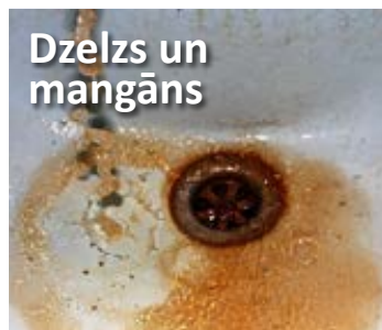
Dzelzs un mangāns

Privātmājai var uzstādīt kārtidžu mehāniskos filtrus ar dažādu filtrācijas pakāpi. Var izmantot arī manuālas vai automātiskās skalošanas smilšu filtrus – WATEX MQ sērijas.