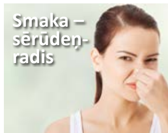
Smaka – sērūdeņradis

Labākais risinājums šai problēmai ir aerācijas metodes ūdens filtri, kuru skalošanai netiek izmantoti nekādi reaģenti. Automātiskās skalošanas filtri WATEX CMB, RCMB efektīvi attīrīs ūdeni un kalpos ilgi, bez īpašas aprūpes. Tāpat efektīvs dzelzs attīrīšanas risinājums ir jonu apmaiņas sveķu filtri WATEX CMS, kas arī vienlaicīgi mīkstina ūdeni (samazina katlakmeni). Skalošanai tiek izmantots reaģents – sāls (NaCl).